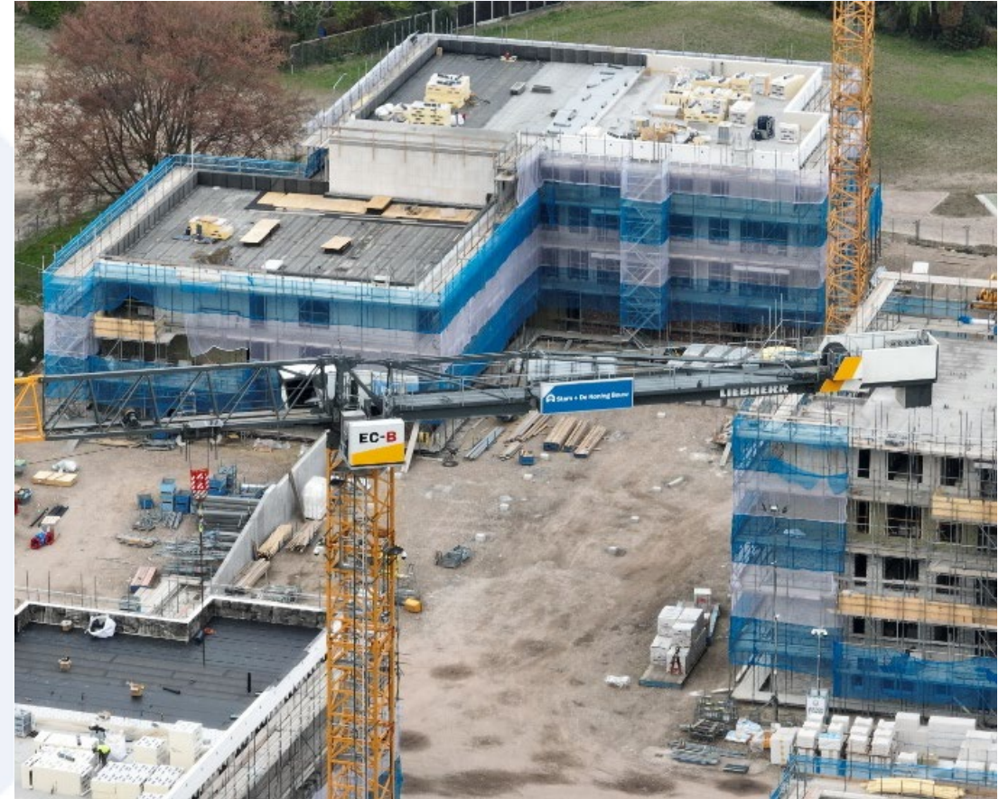
Controle op gebruik PBM's en netheid bouwplaats.

Tegelijkertijd is gebruik van deze beelden belangrijk voor de veiligheid op de bouwplaats. Denk hierbij aan gebruik van PBM's maar ook controle op toegankelijkheid en inrichting van de bouwplaats.