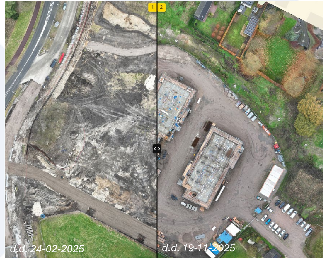
Vergelijk van het terrein per datum.

Deze informatie kan later altijd worden teruggehaald en vergeleken.